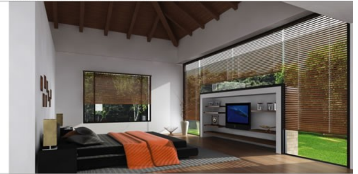
IMAGEN INTERIOR DE LA ALCOBA PRINCIPAL