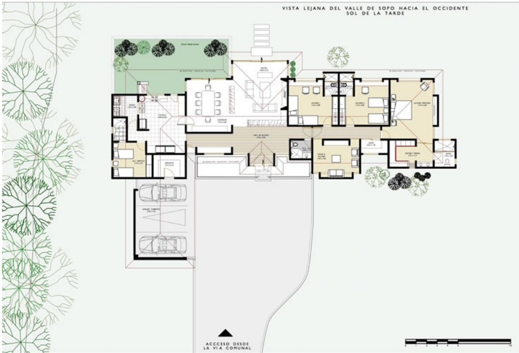
PLANTA DE PRIMER PISO