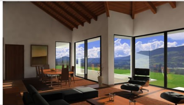
PERSPECTIVA INTERIOR DEL SALÓN, COMEDOR Y TERRAZA CON VISTA AL VALLE DE SOPO