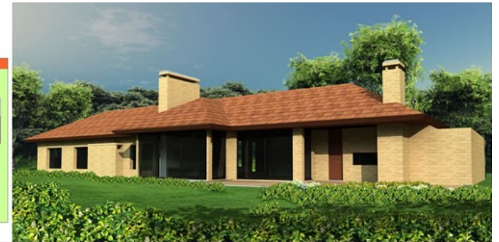
PERSPECTIVA EXTERIOR FACHADA HACIA LA VISTA LEJANA