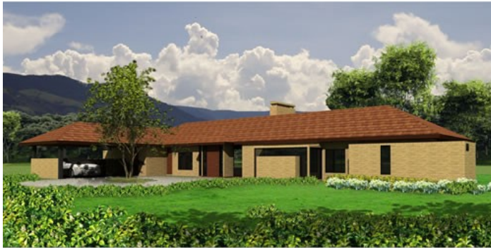
PERSPECTIVA EXTERIOR DEL ACCESO