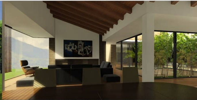
PERSPECTIVA INTERIOR DEL SALÓN Y COMEDOR CON VISTA LEJANA AL VALLE DE SOPÓ. PATIO