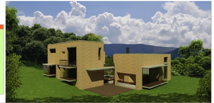
PERSPECTIVA EXTERIOR HACIA EL "DECK"