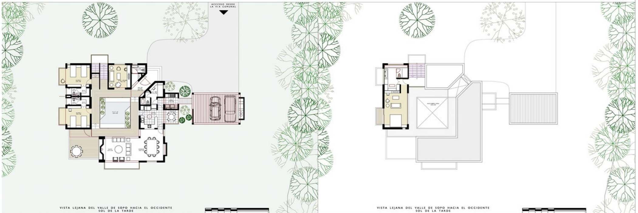
PLANTA DE PRIMER PISO