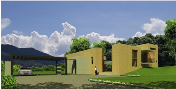
PERSPECTIVA EXTERIOR MIRANDO EL ACCESO